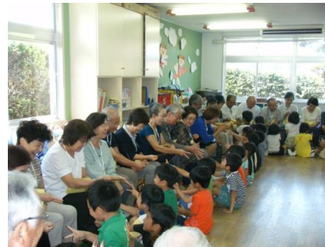
触れ合い遊び “お寺のおしょさん” “しゅうまいジャンケン”など来て下さった方々と遊びました