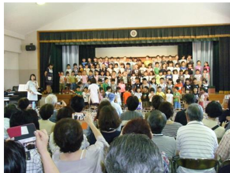
年中・年長両日ともホール舞台上に並びようこそその言葉と歌のプレゼントで Welcome !