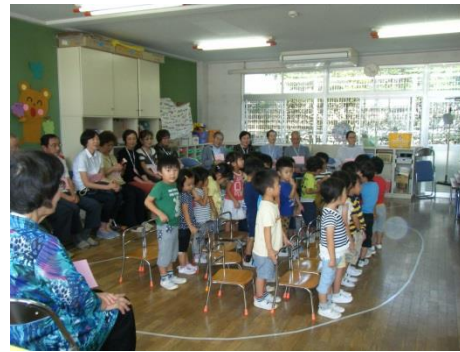
年少組は各クラスに招いて参観日がスタート！ 朝の集まりを見てもらいました