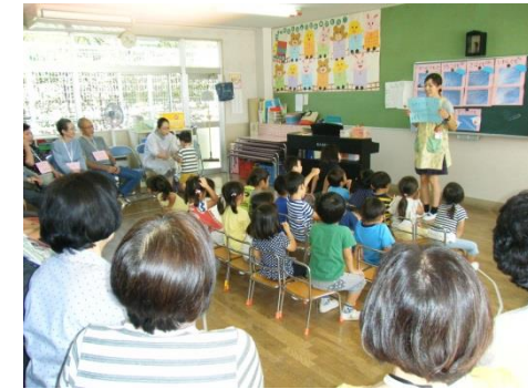
年少さんからもおじいちゃんとおばあちゃんに質問です 「どんなおやつを食べていましたか？」