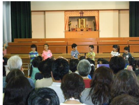
当番活動 前に出て、いつも通り大きな声で言うことができました