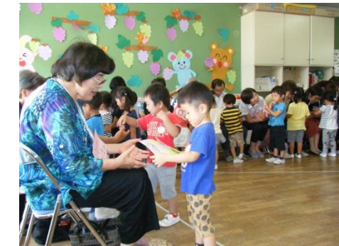
プレゼント渡し おじいちゃんおばあちゃん、いつも優しくしてくれてありがとう