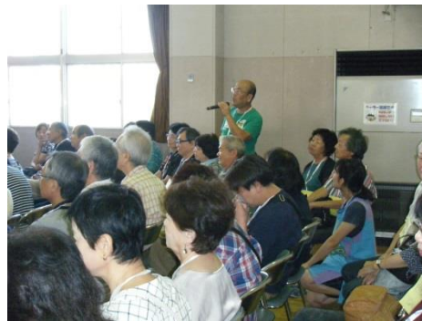
年長さんからたくさんの質問が出ました。丁寧に答えて下さり、ありがとうございました